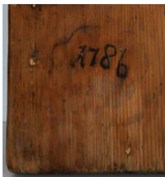
Fig. 148. Detaliu verso cu anul inscripționat în colțul din stânga jos

Foarte clar se detașează cuiele metalice din cantul superior și inferior, soful utilizat pentru vizualizare permițându-ne aprecierea dimensiunii lor la