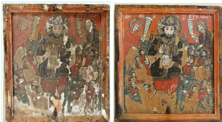
Fig.143-144. Deisis , nr. inv. 242-OC. Ansamblu față înainte și după restaurare

aceiași aspect în ceea ce privește textura și culoarea, degradările similare dar mai accentuate în cazul prezentei icoane, distrugerile prin ardere ne apar similare ca poziție și profunzime ne conduc la concluzia că piesele au fost executate de același meșter. Mai mult, pe verso icoana Nașterii Domnului are menționat cu negru un număr 1786 care era încadrat de un contur lobat realizat tot cu negru (fig.147), care însă se păstrează parțial. Putem presupune justificat că cifra reprezintă anul executării icoanei, an care se înscrie perfect ipotezei formulate în cazul anterior de Marius Porumb.