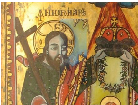
Fig. 362. Detaliu comparație

icoanelor. Dincolo de aceasta, din observațiile noastre putem spune că în toate icoanele pe care le semnează am identificat prezența foiței metalice aurii. 2 În urma comparațiilor imaginilor digitale, prin alipire pe verticală, prin alăturare și punere în context a elementului comparat (fig 354-357), s-a pus în evidență tocmai diferența de trasare a liniei, care analizată comparativ pare chiar grosieră. Păreră noastră este că deși cele două icoane au o sursă de inspirație comună totuși autorul acestei icoane ne semnate nu este Savu Moga. De asemenea menționăm compararea celor două icoane cu tema Încoronării Precestei , una semnată de Savu Moga (Nr. inv. 1142-OC), cealaltă atribuită lui (Nr. inv. 1126-OC). Analiza noastră a presupus decuparea unui element martor – Chipul lui Iisus – din icoana de referință și plasarea alăturată elementului de comparat, suprapunerea zonei decupate pe zona corespunzătoare din icoana de comparat și o comparație prin alipire pe verticală. Rezultatul este unul surprinzător, elementul decupat integrându-se foarte bine în compoziție, având chiar zone de continuitate, ceea ce ne conduce la concluzia că icoana ne semnată aparține cu adevărat zugravului Savu Moga (fig. 362).