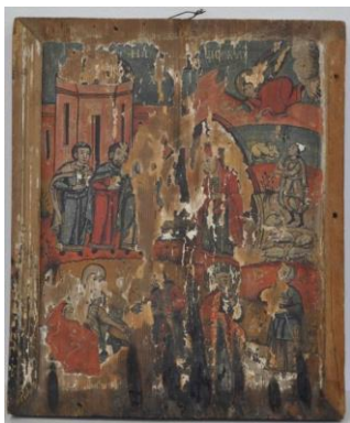
Fig. 145. Nașterea Domnului , Nr.inv. 236-OC, Ansamblu înainte de restaurare

suficientă o singură expunere. Ca atare, nu au fost necesare prelucrări ulterioare ale imaginii master. Imaginea obținută (fig. 146) este de bună calitate și ne relevă câteva particularități ale artefactului. Astfel, putem observa că suportul este unul neuniform, cu noduri fixe evidențiate foarte bine în radiografie, înregistrate în imagine ca zone cu aspect relativ circular (fig. 149), foarte luminoase (densitatea lemnului este mult mai mare față de restul panoului și ca atare avem o atenuare puternică a radiației electromagnetice).