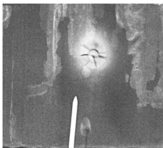
Fig. 149. Detaliu Rx. Se observă urma de cui din lemn, cuiul metalic și nodul concrescut

În urma comparării imaginii RX cu artefactul, putem emite câteva opinii cu privire la natura pigmentilor utilizați. În acest sens, menționăm zonele de culoare albă sau în combinație cu alb care dau un semnal luminos care ne sugerează utilizarea albului de plumb. Nuanțele de roșu așa cum au fost înregistrate de imaginea Rx ne sugerează că meșterul a utilizat atât roșu miniu (posibil cu conținut de cinabru) dar și roșu pe bază de pământuri. Putem remarca și din radiografie, finețea în relizarea inscripțiilor și a unor detalii.