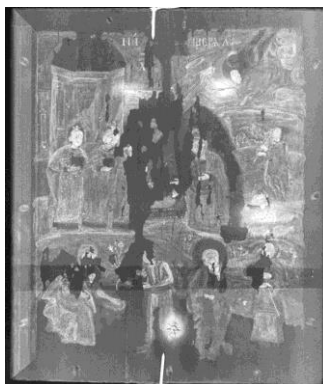
Fig. 146. Imaginea radiologică