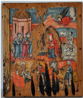
Fig. 147. Ansamblu după restaurare