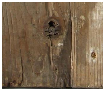
Fig. 150. Detaliu verso în zona corespondentă

Zonele lacunare sunt destul de întinse, în radiografie înregistrându-se ca zone cu aspect neregulat în tonalități de gri închis. Putem menționa și faptul că zonele în care sunt vizibile arderile avem un semnal mai închis ceea ce demonstrează că structura suportului a fost afectată. Craclurile straturilor picturale precum și fisuri și crăpături ale suportului sunt de asemenea înregistrate de imaginea radiografică.